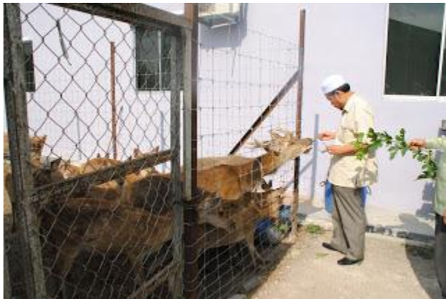
YB EXCO Pertanian memberi makan kepada rusa sempena lawatan kerja ke Ladang rusa Rhong Chenok pada 05/04/2016

Bagi RMK 11, Jabatan ingin menyelaraskan peruntukan bagi Rancangan Projek Pawah Rusa diselaraskan dibawah satu kod iaitu dibawah kod P26005 dan digunakan sepenuhnya untuk pembelian ternakan hidup. Penambahbaikan ini bertujuan bagi menambah jumlah dan bilangan penternak untuk menyertai program ini. Melalui penambahbaikan ini penternak penternak yang mempunyai kemudahan kandang dan kawasan tetapi tidak mampu untuk membeli ternakan rusa akan di beri ke utamaan semasa proses pemilihan peserta.