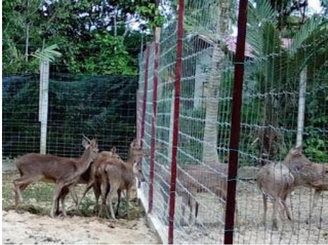
Projek Printis Pawah rusa DVS Kelantan

Antara matlamat menyambung semula program ini adalah dengan tujuan membantu penternak penternak kecil yang berpotensi mengembangkan perusahaan ternakan. Jabatan mengagihkan ternakan kepada penternak untuk dipelihara sebagai pinjaman (Kredit Ternakan) dengan cara ini kerajaan telah dapat mengurangkan kos pengurusan ternakan.