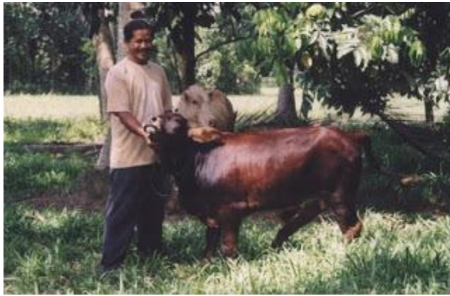
Penternak bersama ternakan dibawah projek jabatan

Bagi projek projek anjuran Jabatan, pengeluaran daripada penternak penternak kecil yang menjalankan aktiviti untuk saradiri, walaupun akan diteruskan tetapi akan dikurangkan peringkat demi peringkat.