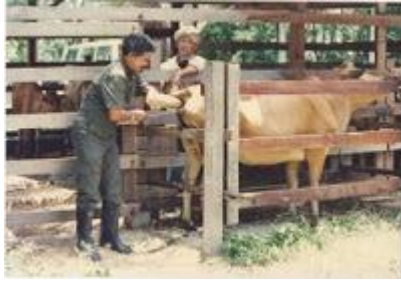
Aplikasi teknologi Pembiakan secara Permanian Beradas bagi meningkatkan kualiti ternakan