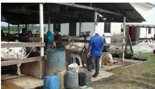
Kandang , infra dan lanatam asas projek` Bridlot'

Projek ini merupakan perancangan jangka panjang untuk membangunkan sumber genetik lembu di negeri Kelantan bagi menghasilkan sebanyak mungkin bekalan induk-induk lembu pedaging dari generasi F1 kacukan Charolais-KK yang berkualiti bagi membantu meningkatkan pengeluaran daging dalam negeri, sejajar dengan slogan Bertani Satu Ibadah serta Plan Strategik Pertanian Negeri Kelantan ke arah menjadikan Negeri Kelantan sebagai Jelapang Makanan Negara . Bagi tujuan ini, induk-induk dari baka Kedah-Kelantan yang dikacuk dengan baka Charolais (melalui kaedah permanian beradas) akan dijadikan sebagai asas dalam membangunkan sumber genetik ternakan yang terlibat.