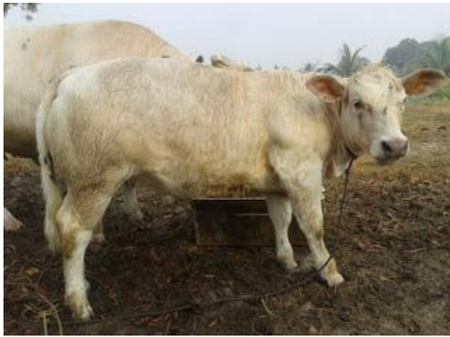
Anak lembu kacukan yang berkualiti dihasilkan melalui program pembangunan sumber genetik baka baru

Untuk meningkatkan populasi dan kualiti genetik ternakan ruminan tempatan bagi membolehkan industri ternakan mencapai dan memenuhi keperluan daging dan susu negara.