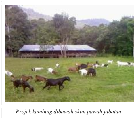
Projek kambing dibawah skim pawah jabatan

Penternak-penternak baru yang berminat serta memenuhi kriteria yang diperlukan akan akan dikenalpasti serta penternak penternak yang berdayamaju dan memiliki unit ternakan yang melebihi 50 ekor induk pembiak akan dikategorikan sebagai penternak komersil. Mereka akan terus dibimbing melalui latihan yang berkaitan agar pemindahan teknologi dapat dilaksanakan untuk kesinambungan teknik pengurusan yang lebih baik.