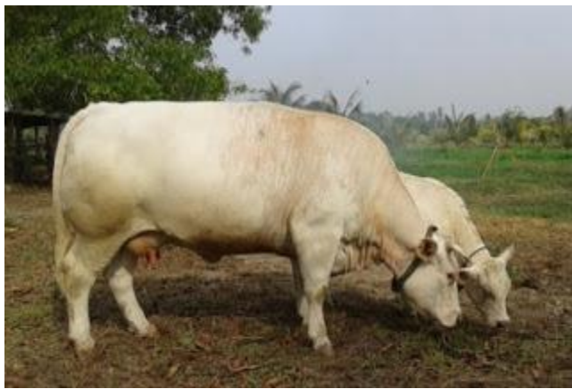
Induk lembu kacukan yang berkualiti hasil dari pembiakan secara Permanian beradas

Berdasarkan perkembangan semasa populasi lembu pedaging kacukan di negeri ini, menjelang tahun 2015, kadar induk kacukan dalam populasi dijangka hanya mencapai tahap 7 peratus sahaja, sedangkan objektif Pelan Strategik Pembangunan Pedaging Negeri Kelantan meletakkan angka 20 peratus yang perlu dicapai. Diantara punca yang dikesan ialah berlakunya penjualan induk-induk kacukan keluar negeri disebabkan permintaan yang tinggi. Dengan wujudnya projek ini, kerajaan mempunyai dana untuk membeli induk-induk berkualiti yang dikeluarkan oleh penternak dan seterusnya dikembangbiak di dalam negeri ini.