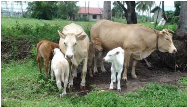
Induk dan anak lembu kacukan dibawah projek `Bridlot'

Keutamaan projek ini adalah untuk mewujudkan peluang perniagaan tani di kalangan penternak khususnya golongan belia yang berpotensi. Projek ini akan melibatkan perkongsian pintar antara Kerajaan dengan peserta dimana kedua-dua pihak mempunyai komitmen masing-masing dalam menjayakan projek ini. Melalui projek ini, Kerajaan akan menyediakan sumbangan modal berupa baka ternakan, manakala peserta perlu menyediakan prasarana kandang dengan masing-masing nisbah modal 80% : 20%.