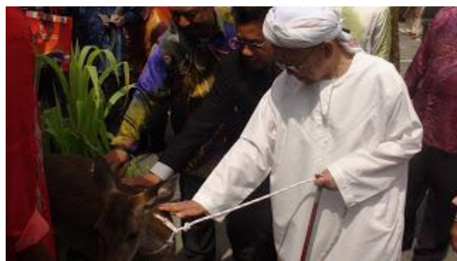
Arwah YAB Tok Guru Menteri Besar Kelantan membelai rusa sempena Majlis pelancaran Projek Pawah Rusa -7/04/ 2013

Rancangan perintis pemeliharaan rusa pawah adalah merupakan satu program jabatan dalam Industri pembangunan ternakan bertujuan untuk mengembangkan Industri penternakan rusa di Negeri Kelantan. Program ini secara tidak langsung mewujudkan jalan alternatif dalam perolehan sumber protein di Negeri Kelantan.