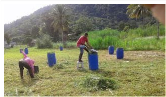
Penyediaan silaj secara manual sebagai simpanan makan diwaktu kecemasan

Masih terdapat banyak sumber bahan hijau dari sisa pertanian yang boleh dimanfaatkan sebagai sumber makanan ternakan yang lebih murah dan bermutu yang belum dioptimumkan sepenuhnya