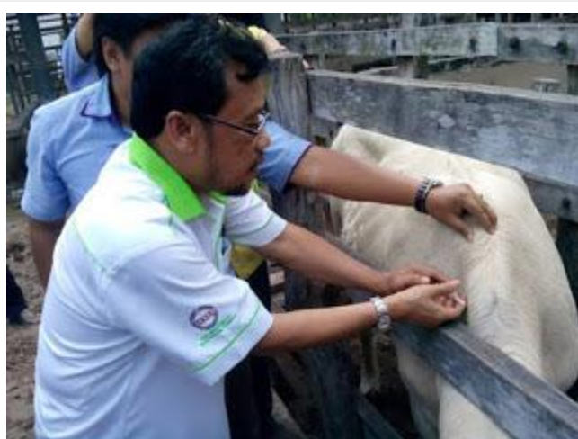
YB EXCO memasang Rfid kepada lembu pawah projek `Bridlot` di kg.Bendang Pak Yong,Tumpat

Program Pemiakan Lembu Pedaging Kacukan Secara Bridlot ini merupakan cadangan aktiviti di bawah Rancangan Operasi Induk-Anak yang sedang dilaksanakan oleh Kerajaan melalui Jabatan Perkhidmatan Perkhidmatan Veterinar di bawah Peruntukan Pembangunan P26 : 26001. Sebelum ini, Peruntukan P26 : 26001 (Rancangan Operasi Induk-Anak) digunakan untuk pembelian induk-induk lembu baka tempatan untuk diagihkan secara pawah kepada penternak.