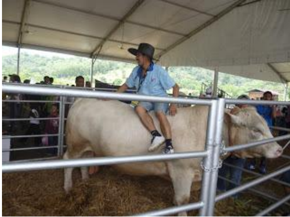
Lembu kacukan Charolais dari Kelantan beraksi di MAHA