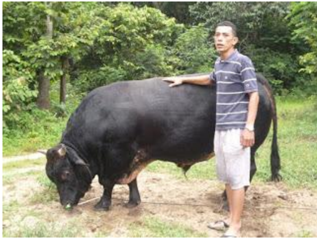
Projek lembu kacukan meghasilkan produktiviti yang tinggi kepada pengeluaran daging tempatan

Asas dalam penyediaan kertas-kertas cadangan ini ialah impak serta outcome yang diperolehi dari pelaksanaannya seperti manfaat kepada pelbagai golongan sasaran seperti petani atau penternak berskala kecil dan sederhana, golongan usahawan belia yang bakal mewarisi kelangsungan industri penternakan dan industri asas penternakan serta juga golongan wanita dan amalah yang kesemuanya dikenalpasti sebagai kumpulan sasaran di dalam Dasar Bertani Satu Ibadah serta juga Pelan Strategik Pertanian Negeri Kelantan.